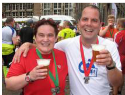
Mit dem wohlverdienten Getränk